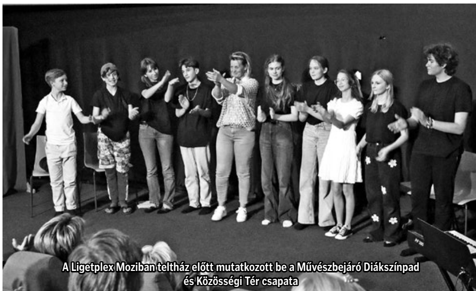
A Ligetplex Moziban teltház előtt mutatkozott be a Művészbemutató Diákszínpad és Közösségi Tér csapata

A gyerekek fáradhatatlanok voltak, további próbákat és plusz órákat vállalva készültek, sőt még egy szakmai kirándulást is beváltak Kecskemétre, ahol a Bács-Kiskun Vár-