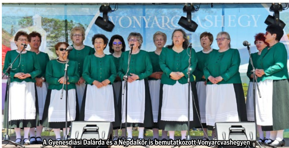
A Gyenesdiási Dalárda és a Népdalkör is bemutatkozott Vonyarcvashegyen