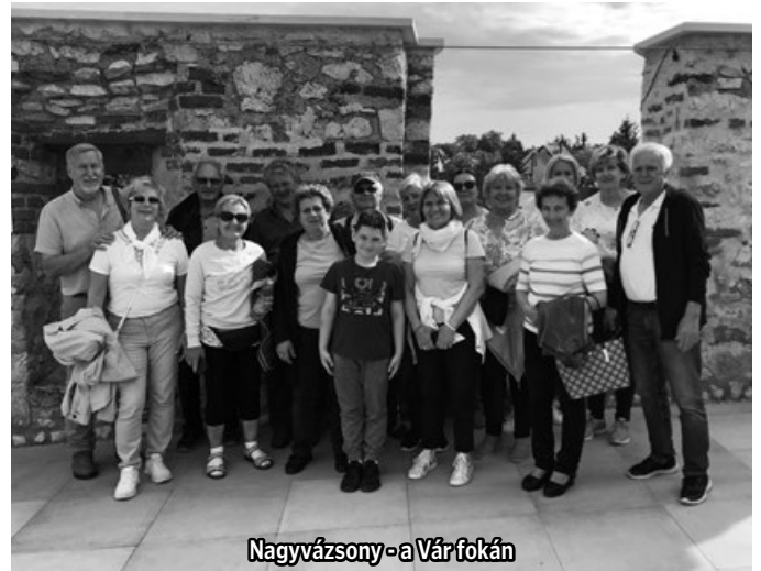
Nagyvázsöny-a Vár fokán

Csodálatos program lesz, melyre érdemes lesz eljönni! Jelentkezni rá az útiköltség be-