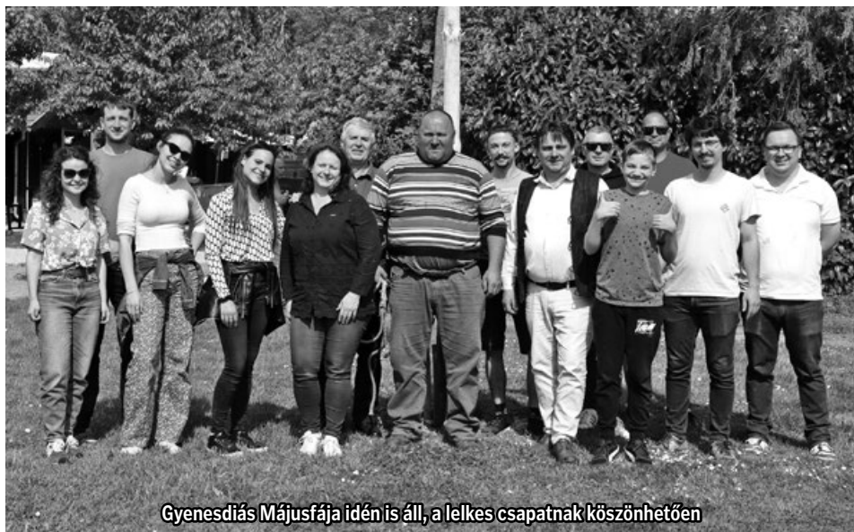
Gyenesdiás Májusfája idén is áll, a lelkes csapatnak köszönhetően

Idén is hipp-hopp eljött április vége, ami ilyenkor a főszezonra való felkészülés mellett az ország sok kistelepülésén – így Gyenesdiáson is – a májusfa állítások ideje. A szép időben sokan voltak kíváncsiak a helyi férfiak „erőpróbájára” a piac mellett, melyhez azért