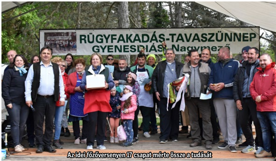
Az idei főzőversenyen 17 csapat mérte össze a tudását

A térségi Forrásvíz Természetbarát Egyesület tagjainak nevében ezúton szeretnénk megköszönni a 24. alkalommal megrendezésre került „Rügyfakadás-tavasziünnep” kulturális és környezetvédelmi szabadtéri rendezvény lebonyolításában segítők fáradozását, támogatását és a szervezésben való aktív szerepvállalását.