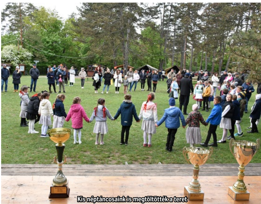
Kisnéptáncosaink is megtöltötték a teret

A táncos - zenei est meglepetés együttese a Gyenes Néptáncgyűttes volt, akik a hűvös idő ellenére kitartottak és igazán szép produkciókat mutattak be a közönség legnagyobb öröme. A fellobbanó tábornúthoz levonult kis táncos igazán szép és méltó zárása volt a programnak.